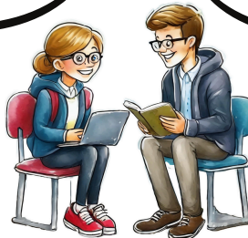
KUVA 6: Tarvittavat tunnuksot ja ohjelmat sujuvaan työskentelyyn. Hahmot on luotu Adobe Fireflyllä.

Muut sovellukset asennetaan KamITin toimesta. Kaupungin tietohallinto huolehtii sovellusten tietosuojan (GDPR) toteutumisesta.