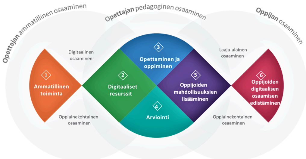
KUVA 3: Euroopan komission yhteisen tutkimuskeskuksen tuottama DigCompEdu-viitekehys kuvaa opettajien digitaaliseen osaamiseen liittyviä kompetensseja kuudella osa-alueella. (Pakanen, Hurme & Länsitie 2023.)

Työnantaja vastaa opetushenkilöstön koulutusten järjestämisestä. Koulusta voidaan toteuttaa sisäisesti hyödyntämällä koulujen digituutoritoimintaa. Kajaanin perusopetuksen digituutoreiden kouluttaminen ja heidän yhteistoimintansa ovat keskeinen osa opettajien osaamisen kehittämistä. Ulkoisia koulutuksia voidaan järjestää yhteistyössä muiden Kajaanin koulujen ja kajaanilaisten tai kainuulaisten toimijoiden kanssa.