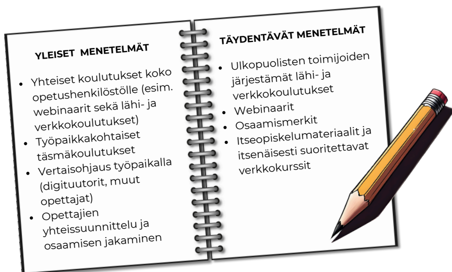
KUVA 7: Opetushenkilöstön osaamisen kehittämisen menetelmät. Kuva on luotu Canvan Maaginen-media sovelluksella.

4. Jokaisessa koulussa tulisi olla vähintään yksi digituutori, jotta digitaalisen osaamisen kehittäminen olisi mahdollisimman vaikuttavaa. Digituutorin rooli on tarjota pedagogista tukea työyhteisölle sekä auttaa opettajia hyödyntämään digitaalisia työkaluja opetuksessa ja opetuksen suunnittelussa.