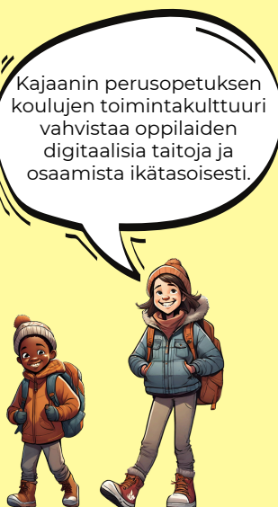
KUVA 2: Perusopetuksen toimintakulttuuri. Hahmot on luotu Canvan Maaginen media sovelluksella.

Opetuksen tukena voidaan käyttää mm. seuraavia sivustoja: