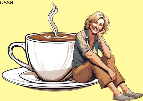
KUVA 4: Opettajan tavoitteet. Kuva luotu Canvan Maaginen media -sovelluksella.